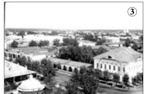
Вид на Шадринск с колокольни Спасо-Преображенского собора. Справа вдали – Князе-Владимирская церковь (утрачена). Справа внизу – дом с балконом купцов Фетисовых. Слева внизу – крыша часовни. Немного выше начинаются торговые помещения Михайловской площади. Начало XX века.