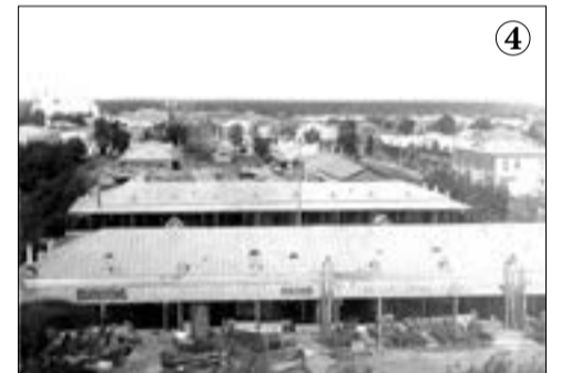
Вид на Шадринск с юга, с колокольни Спасо-Преображенского собора. В середине – Михайловская торговая площадь. Слева сверху – Покровская церковь, самая большая в Шадринске (снесена). Справа сверху – двухэтажное здание почты (ныне главпочтамт, улица Комсомольская, 2). Начало XX века.