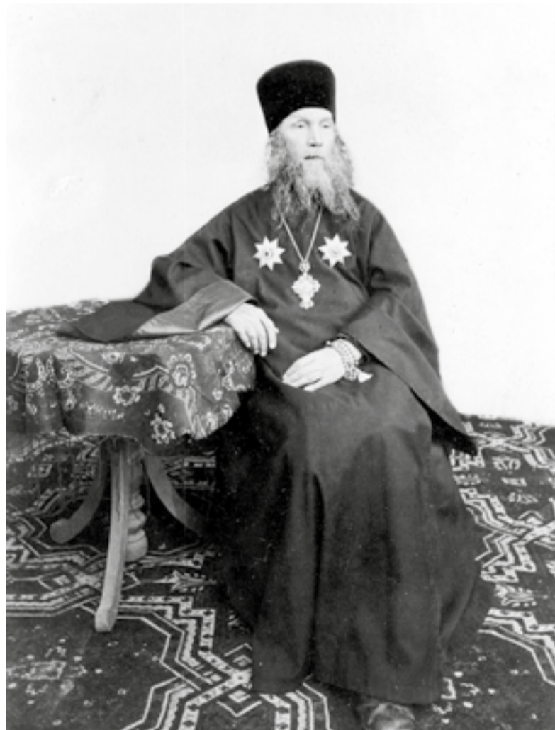
Архимандрит Антонин (Капустин).