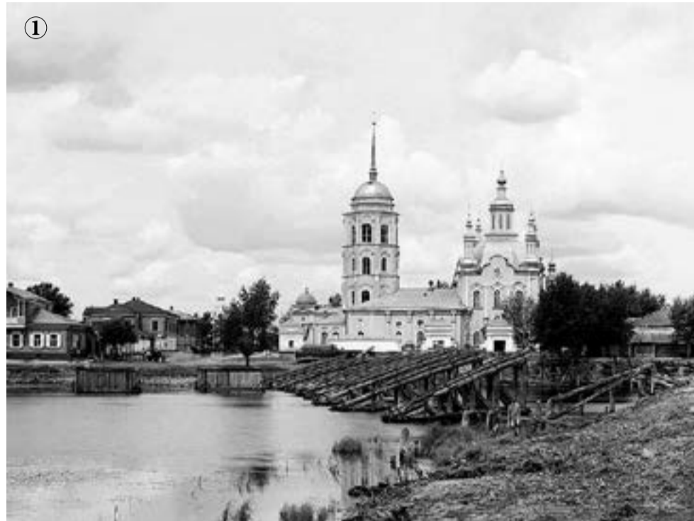
Вид на Спасо-Преображенский собор с юга, от реки. Предположительно, 1912 год.

И вот тот же фотограф как будто забирается на пожарную каланчу, которая