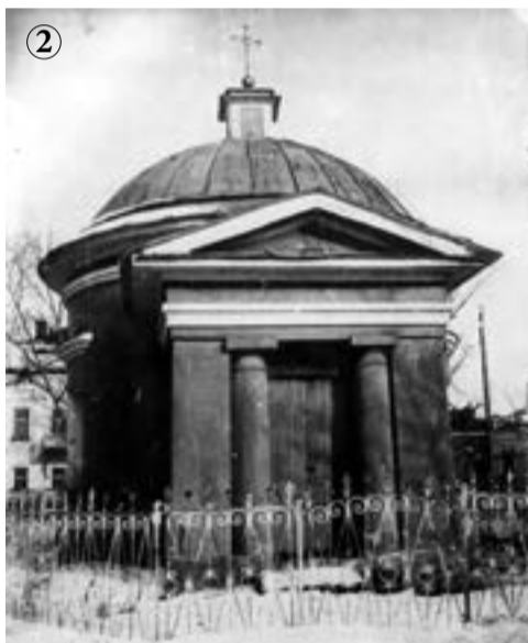
Часовня в честь Преображения Господня. 1924 год.

находилась между Спасо-Преображенским собором и Николаевской церковью (сейчас на этом месте тоже строения пожарной части, а старая каланча – парадокс! – сгорела), поворачивается еще левее – и перед нами еще одна часть Михайловской площади с видом на западную часть города (фото 5).