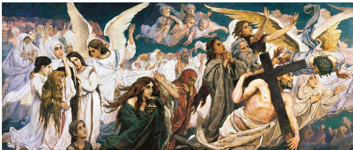
Радость праведных о Господе. «Преддверие рая» — картина Виктора Михайловича Васнецова, созданная в 1896 году.

Надо четко себе уяснить, что обращение к экстрасенсу – это обращение к нечистой силе, то есть фактически отречение от Бога. Церковные каноны налагают на виновных в этом грехе строгие епитимии, приравнивая экстрасенсов, чародеев, колдунов к убийцам. Человеку, который оступился, обратившись к экстрасенсам, необходимо осознать свое заблуждение и искренне раскаяться в этом грехе, придя на исповедь.