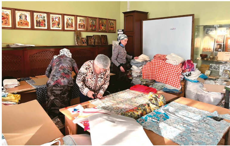
Швеи за работой.

гом углу – этажерка с книжками, корзина с игрушками; прижавшаяся к стене стеклянная витрина с экспозицией об истории собора... Но все пространство помещения занял швейный цех. На всех свободных участках пола – тюки материи, мешки с фурнитурой. Стол настоятеля превратился в место для раскроя, а учебные парты воскресной школы – в подставки для швейных машин. На полках новенького стеллажа аккуратно уложены готовые изделия. Уже знакомые мне женщины склонились над швейными машинками, изредка разгибаясь и переговариваясь, перекидывая их стрекот. Сегодня шьют вкладыши для спальных мешков. Но вот одна из швей, разложив на раскройном столе куски пестрой ситцевой материи, подзывает остальных – нужно посоветоваться. Видимо, ей показалась несолидной расцветка тканей, на что посыпались горячие возражения: