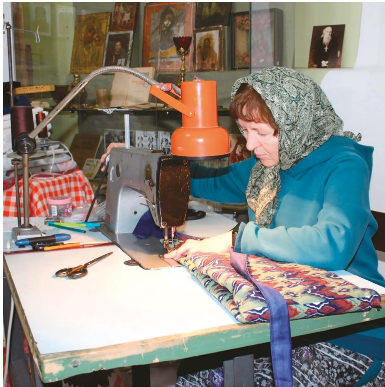
Швеи за работой.

Мой взгляд выхватывает большой письменный стол с компьютером, задвинутый в угол; в дру-