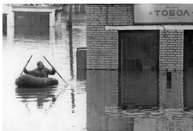
Паводок 1994 г.

Выйдя в одно утро во двор, матушка в малиннике за домом обнаружила целый зоопарк. Здесь были несколько собак разных возрастов, кошки, петух и овечка. Все они жалась к дому и не обижали друг друга, объединенные общей бедой. Увидев матушку, они буквально бросились к ней навстречу. Все дрожали от сырости и голода. Матушка очень любила животных, и ее чуткое сердце отозвалось на эту беду. Совсем уже немощная и слабая, она притащила из сарая сухие доски. Настелила. Кое-кто из несчастных отправился в сарай, другие залезли на сухой подстил. Животные, наверное, почувствовали ее доброту и заботу. Они ничуть не боялись ее, напротив, жалась к ней, прося ласки и защиты.