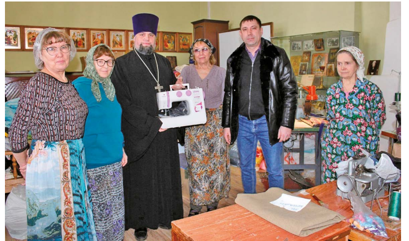
Та самая швейная машинка от главы муниципального округа.

Для улучшения качества работы между штабом и фронтом налажена прямая связь: бойцы тестируют новые изделия, делятся своими впечатлениями, а иногда высказывают пожелания, как усовершенствовать изделие, чтобы удобнее было им пользоваться. С большим удовольствием и гордостью мне показали видео, присланное с фронта: молодой боец в пончо из непромокаемой ткани докладывает о результатах испытания: