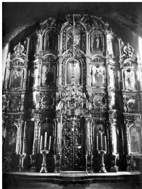
Конец 19 – начало 20 века. Старинный иконостас в главном приделе Спасо-Преображенского собора. Утрачен.