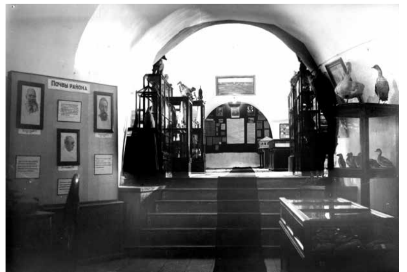
Экспозиция краеведческого музея в здании собора 1952