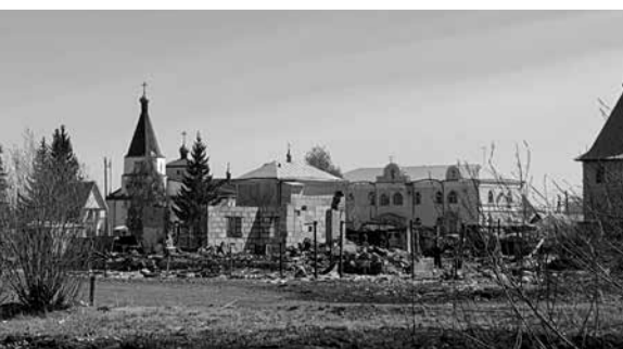
Смолино. Уцелел только храм и 8 домов возле