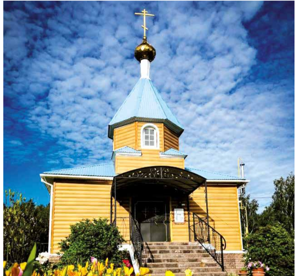
Клирос. Вознесенский храм

А вот о тех, кто рядом от службы к службе, кто находит время для пения и чтения, на ком также лежит огромная ответственность петь не только для прихожан, но и во славу Божию, могу рассказать много и с удовольствием. Наши регенты, две Лены. Те, кто отлично разбирается в хитросплетениях служб, кто легко переходит с тропарного на ирмосный глас, кто вытягивает всё, что пошло «не в ту степь». Спокойные, собранные, уверенные и безмерно терпеливые. За это им отдельная