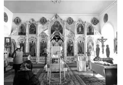
2023 г. Иконостас в Покровской церкви (с. Барнёвка), переданный из Спасо-Преображенской церкви села Батурино.