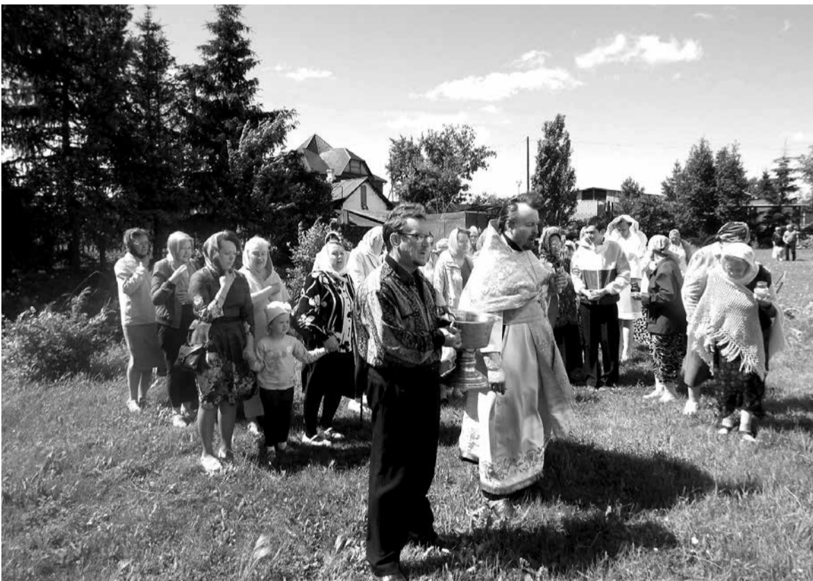
Крестный ход вокруг собора

которые не захотели подчиниться советской власти. Они, уехавшие, и Церковь сохранили, и веру, и службы блюли. Но название-то («Зарубежная») для нас оказалось каким-то неприемлемым. Надо было назвать эту Церковь эмигрантской, а то «Зарубежная» – будто бы не наша. Я их не хвалю. У