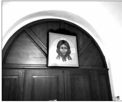
2023 г. Икона «Спас Нерукотворный» перед входом в Спасо-Преображенский собор.