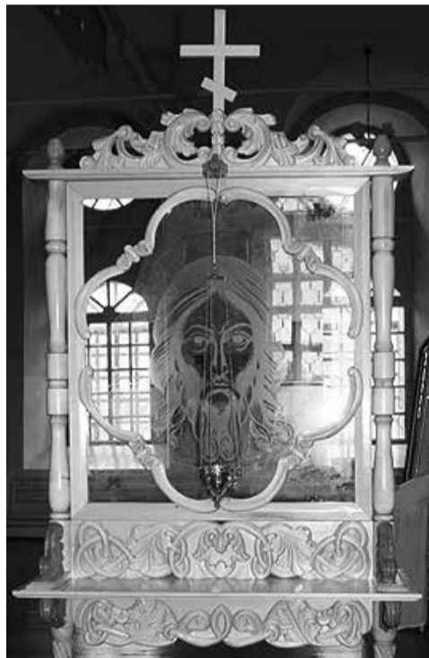
Удвоение иконы «Спас Нерукотворный» на стекле.