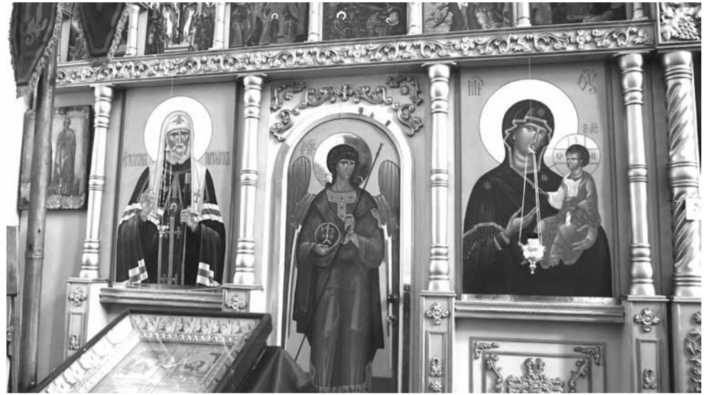
2023 г. Спасо-Преображенский собор. Фрагмент главного иконостаса.

Сейчас Барнёвскую церковь восстанавливают (церковь Покрова Пресвятой Богородицы). Она так удачно стоит. Её отовсюду видно. Недавно там установили иконостас, привезённый из Батуриной церкви, – тот, который я писал. Он ровно и хорошо подошёл к Барнёвской.