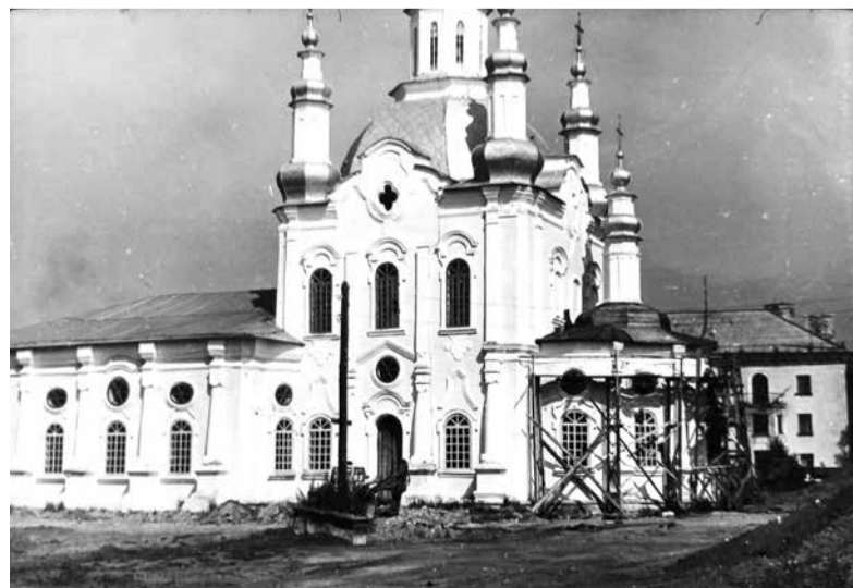
Спасо-Преображенский собор в 1980-е годы (ремонт)