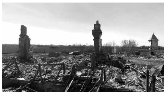
От поселка Смолино осталось пепелище